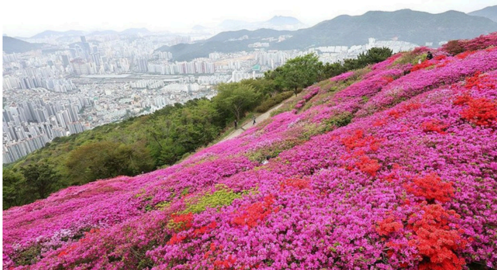
4月下旬の釜山のツツジ

そうした李在明政権の非理に対し、急先鋒に立って追求すべき立場にある「国民の力」だが、戒厳令発布事件の後遺症からいまだ立ち直れていないどころか、内部分裂を示しており、地方総選挙の惨敗を受け、党の解散＝党名変更など出直しを余儀なくされるとの厳しい見方が出ている。